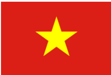
République du Viêt Nam

Les congrès quinquennaux du Parti communiste du Viêt Nam (PCVN), qui contrôle la totalité du pouvoir dans le pays, attirent toujours l'attention des observateurs, spécialement depuis le VIe congrès, tenu en 1986, surnommé le congrès du Thi M?i (changer pour faire du neuf), et considéré comme le point de départ d'une nouvelle ère nationale. Ces grand-messes sont donc suivies de très près: on s'attend à ce qu'elles annoncent les lignes directrices pour les politiques futures et désignent les principaux acteurs du régime vietnamien.